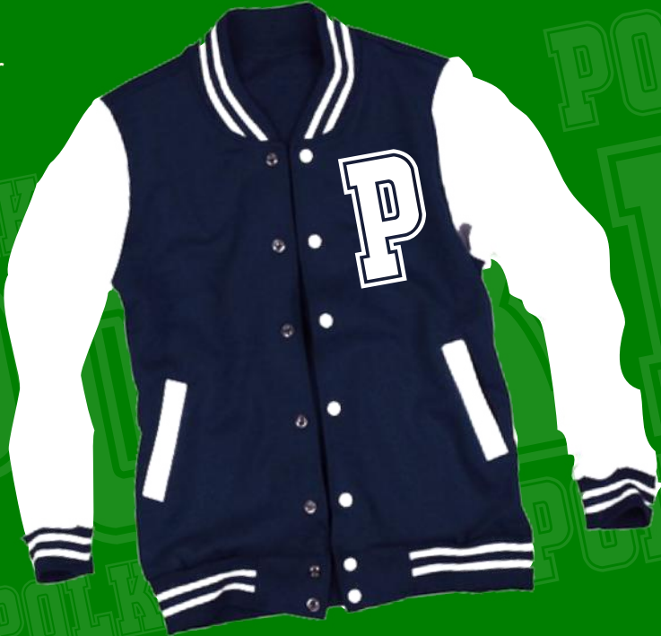
Varsity Jacket American Baseball Club College School Jersey Cotton Team